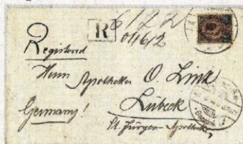
จดหมายถึงอ็อทโท ลิงค์ ด้านหลังมีตราประทับบริษัท ที่ได้รับพระบรมราชูปถุลาจาก ร.5 ให้ใช้ตราส่วนพระองค์

จะไดชมหลักฐานประวัติศาสตร์ที่ทรงคุณค่าเหล่านี้เป็นครั้งแรก “ผมสะสมสิ่งเหล่านี้มา 62 ปีแล้ว จนตอนนี้อายุ 70 ปีก็ยังทำอยู่ ช่วงที่ บี.กริม ครบ 120 ปี ก็มีบางส่วนที่เกี่ยวกับบี.กริม ไปจัดแสดง ตอนนี้ได้เพิ่มเข้ามาอีก เฮาส์แอมป์แผ่นเล็กๆ มาเล่าเรื่องราวคนเยอรมันที่เข้ามาใช้ชีวิตในประเทศไทย ซึ่งเกี่ยวข้องกับ การทูตระหว่างเยอรมันกับสยาม แล้ว