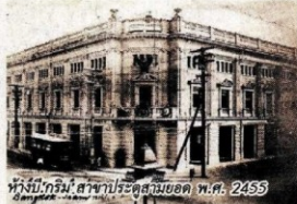
ห้างบี.กริม สาขาประวัติศาสตร์ยุค พ.ศ. 2455